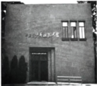
中共三大会址纪念馆

14.（2分）广州市某校的一个历史兴趣小组搜集到一组图片信息，与其相关的主题可以是（ ）