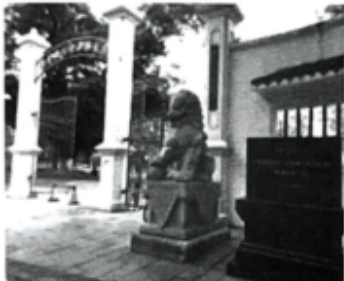
国民党“一大”旧址门口