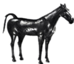
鎏金铜马 (陕西茂陵博物馆)

A. 实行“推恩令” B. 平定七国之乱 C. 与西域有交往 D. 打击富商大贾