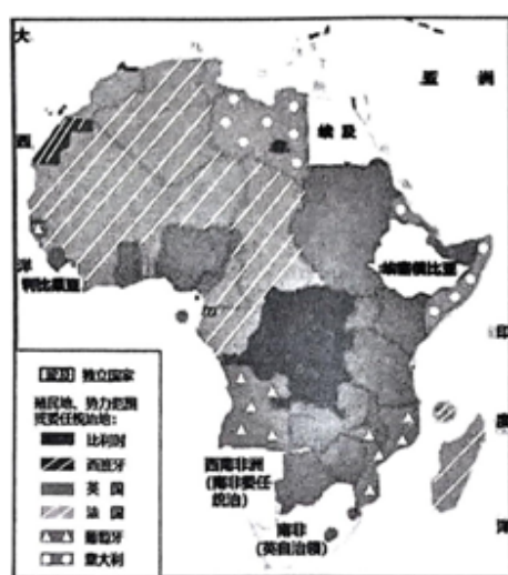
二战前的非洲地图